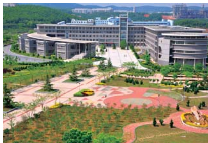
新学部は右側半円形の建物内

市駅を経て少し歩けば旅の終着点、OICに到着。ほぼ完成した新たな学舎に気持ちが高ぶった。全6回にわたってお届けした企画。BKC→宇治→伏見稲荷→出町柳→衣笠→大山崎→OICと計約100キロを歩いた。